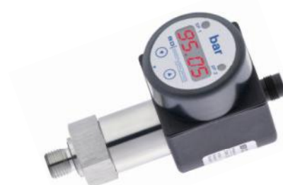
Рисунок 3 - Общий вид преобразователей давления DS, DM