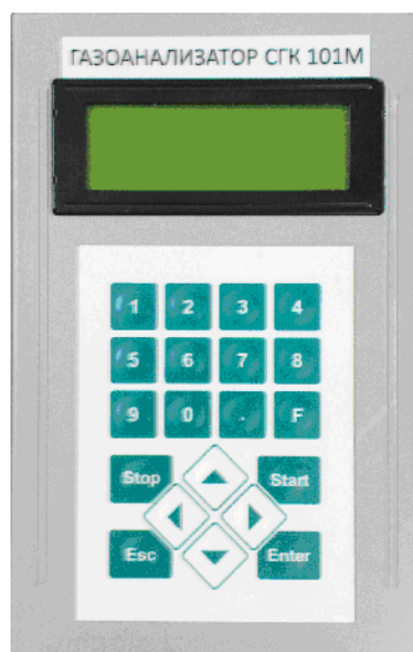
Рисунок 2 – Фотография внешнего вида измерительного модуля